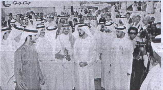
محمد بن راشد يستمع إلى شرح من طهر محمد الطاهر حول امكانيات «فيرى دبي» الأحدث في منظرة النقل البحري بحضور حمدان بن محمد