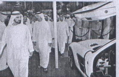
محمد بن راشد خلال جولته التفقدية في المعرض بحضور حمدان بن محمد