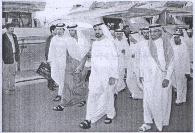
محمد بن راشد خلال زيارته لمعرض دبي العالمي للقوارب بحضور حمدان بن محمد