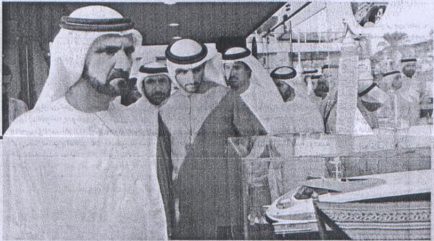
...ويطلع على أحدث البحوث المعروضة بحضور حمدان بن محمد

نائب رئيس الدولة يشهد بالإقبال المتزايد للشركات الوطنية والإقليمية والدولية للمشاركة في الحدث العالمي