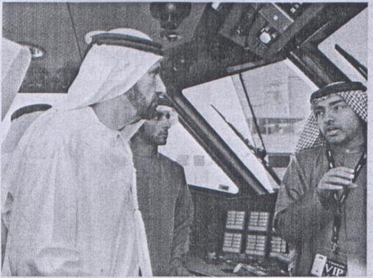
محمد بن راشد خلال جولته في المعرض بحضور حمدان بن محمد