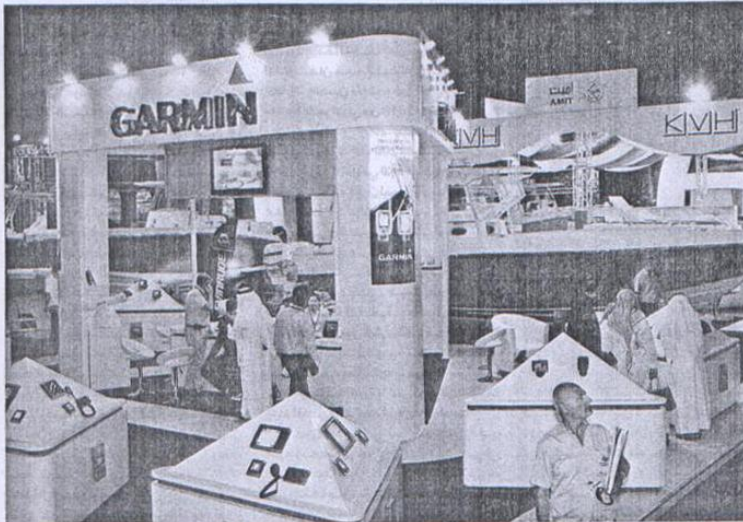
يعتبر معرض دبي العالمي للقوارب أحد أبرز الفعاليات العالمية في قطاع الصناعات البحرية والترفيهية في العالم (البيان)

الإيطالية المتوسطة والصغيرة في القطاع البحري إلى أن حجم مشاركة الجناح الإيطالي ارتفعت في العلم الماضي بمعدل 20 / ليبلغ إجمالي العدد 27 شركة متخصصة في قطع الغيار وكسوفات اليخوت والمرايا وانضمت من هناك عدداً من الشركات الجديدة التي تعرف خدمات شحن اليخوت وصناعات المرابي، وقالت: تسعى الشركات الإيطالية المشاركة بصفة دورية في الحدث لأسباب عدة أهمها البحث عن الفرص الاستثمارية الجديدة والمخول في أسواق جديدة من خلال دبي حيث لها شكل محطة لربط الأعمال والاستثمار ومن جهة أخرى طلبت الشركات الإيطالية القوم في دبي وعرض منتجاتها.